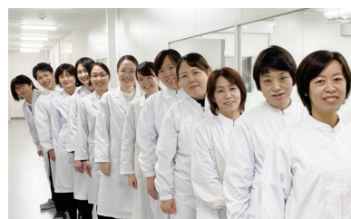
糧配スタッフの皆様

を導入できたことは、ここ6年からの課題が改善でき大変感謝いたしております。試行錯誤の毎日ですが、給食内容の充実業務に邁進してまいります。(吉村)